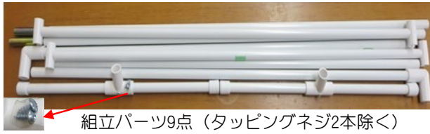
組立パーツ9点 (タッピングネジ2本除く)