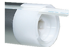
ローラーパイプ(角穴軸)