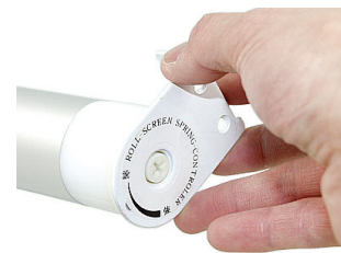
角穴ブラケット本体を反時計まわりに 15回まわします ※写真1